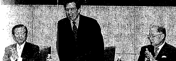
●馬英九總統17日出席「我國加入TPP與RCEP推案策略規劃研習會」。