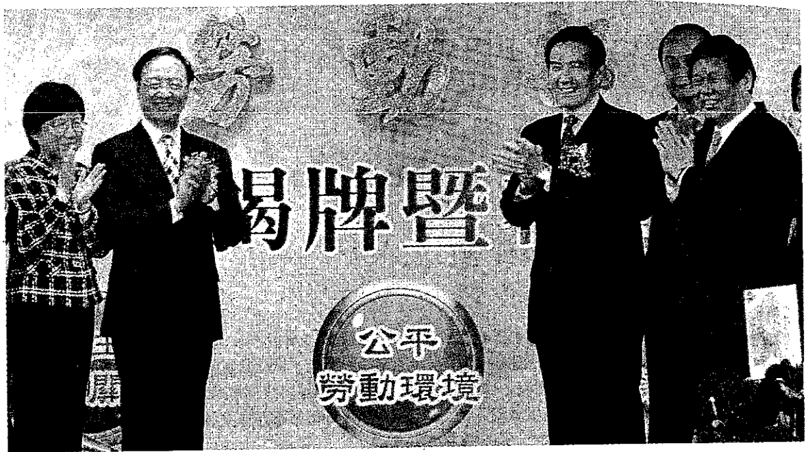
●配合行政院組織改造，勞委會改組為勞動部，17日上午由總統馬英九（右三）、行政院長江宜樺（左二）及首任勞動部長潘世偉（右一）等人正式揭牌運作。