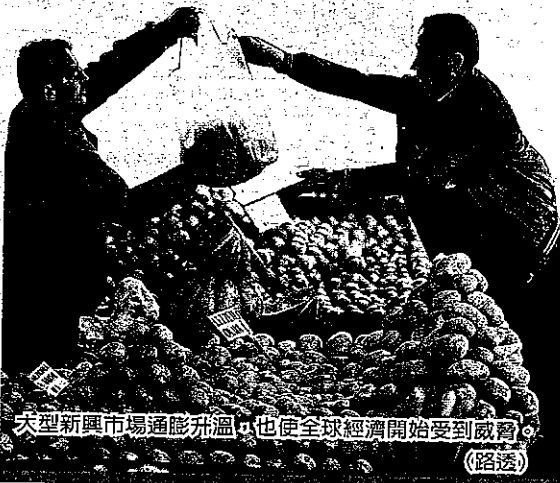
大型新興市場通膨升溫，也使全球經濟開始受到威脅。

飆升而銳減20%。先進國的處境則截然相反，多年來的寬鬆貨幣政策未能刺激經濟快速成長和通膨上揚。在占全球半數經濟產值的開發中國家通膨持續增溫的狀態下，先進國家對成長的期望可能連帶受拖累。