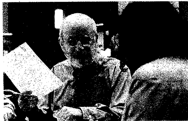
美國上周首次申請失業救濟金人數降到三個月來最低。

另外，美國1月工業生產訂單下降0.7%，降幅比預估的0.5%大。但不含運輸設備的訂單成長0.2%。