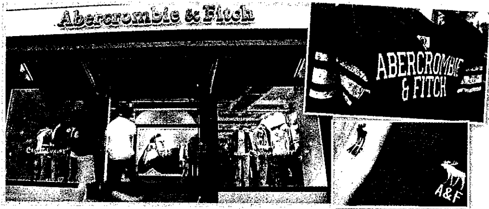
Abercrombie & Fitch (A&F) 明春將在北美停售印有公司商標圖案的服飾，以順應青少年不再追逐名牌，改以自由混搭凸顯個人風格的轉變。

十年前，印有A&F圖案的服飾，曾是青少年覺得酷炫的必備行頭，但如今在北美市場卻顯得過時，常淪為折