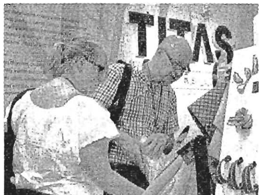
▲創新展品吸引專業買家目光

瑞典Peak Performance也是第一次來台參加TITAS。他們認為，近10年來，台灣廠商技術大幅增進，再加上價格具相當競爭力，大