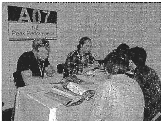
▲紡織品一對一採購洽談會