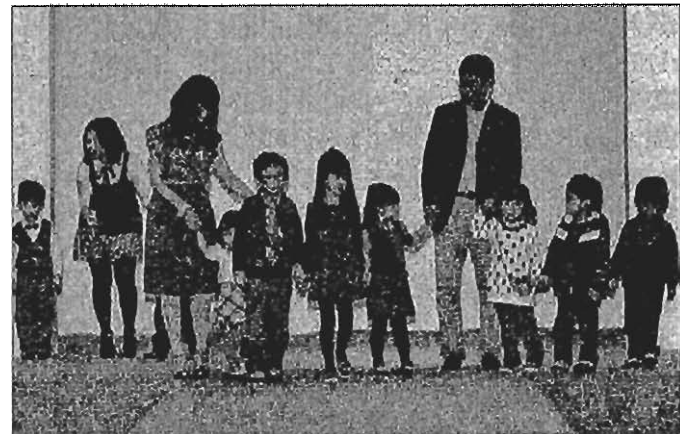
●龍年新生兒大增逾23萬人次，商機上看7年好光景。

不少精品業者早在2-3年前即陸續引進童裝系列，其中不乏Dior、Burberry、Gucci等，微風廣場就準備引進Gucci童裝，藉此擴大精品商品線，衝高客單價，而像是中價位休閒