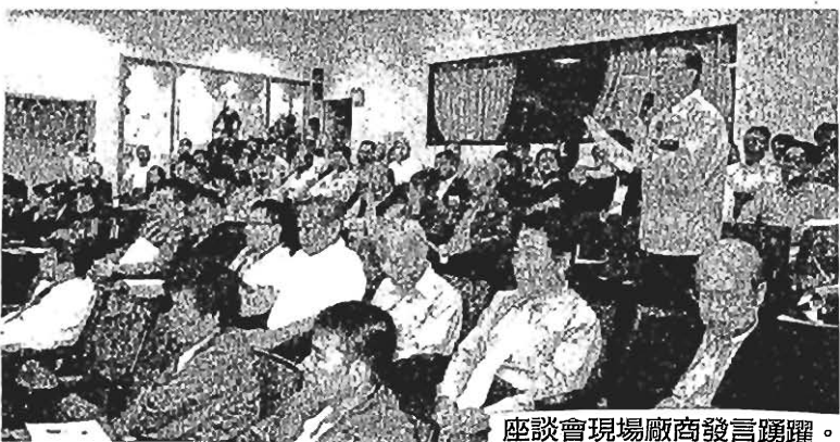
座談會現場廠商發言踴躍。